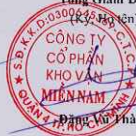
Đặng Vũ Thành